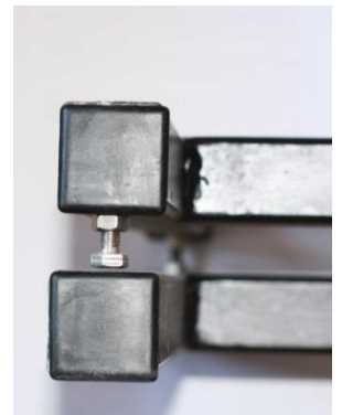
Vis de sécurité